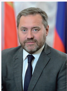
Председатель Законодательного Собрания Санкт-Петербурга БЕЛЬСКИЙ Александр Николаевич